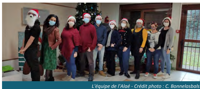
L'équipe de l'Alaé