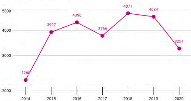
Évolution nombre de prêts

Évidemment la situation sanitaire ternit un peu le tableau mais pas tant que ça, car la bonne nouvelle de ce bilan est que, lorsque la médiathèque est ouverte au public, nous rattrapons presque les bonnes habitudes de 2019 !