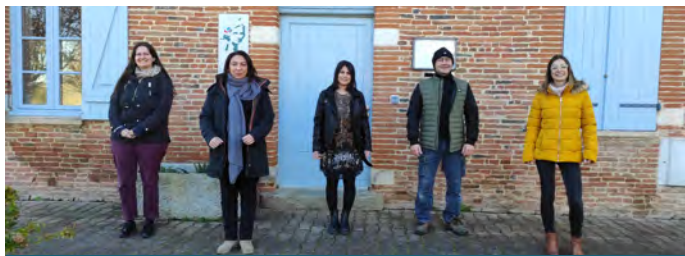
L'équipe des agents municipaux

Vous les croisez à la mairie, à l'école ou dans notre beau village. Vous appréciez leur disponibilité, leur sourire et leur travail. Le bulletin a décidé de vous en dire un peu plus sur l'équipe des agents communaux.