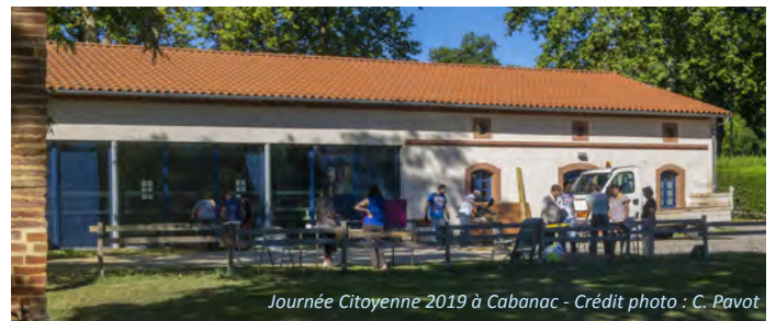
Journée Citoyenne 2019 à Cabanac

Compte tenu du contexte, le calendrier exact reste à préciser, il vous sera communiqué dès que possible.