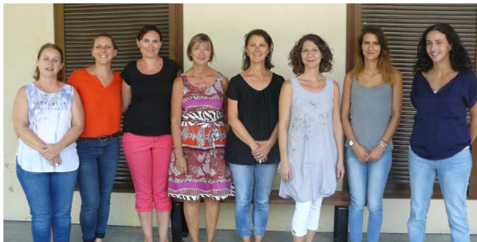
L'équipe enseignante.