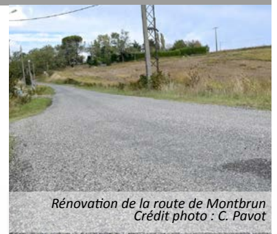
Rénovation de la route de Montbrun