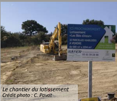
Le chantier du lotissement

Les travaux de voirie et d'installation des réseaux battent leur plein au lotissement de Fontbazy . La construction des 10 pavillons individuels est envisagée pour le tout début de l'année prochaine. Ce nouveau quartier portera le joli nom, bucolique à souhait, de « Blés d'azur ».